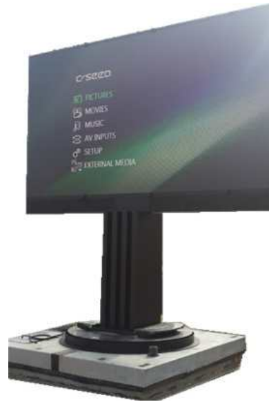
지하 매립 전광판 FRAME ASS'Y