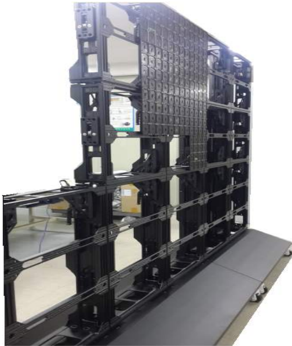
ALUMINUM 압출 가공 및 조립제품