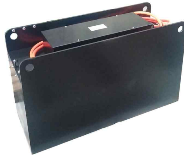
현대중공업 전지지게차 BMS 축전지 CASE ASS'Y