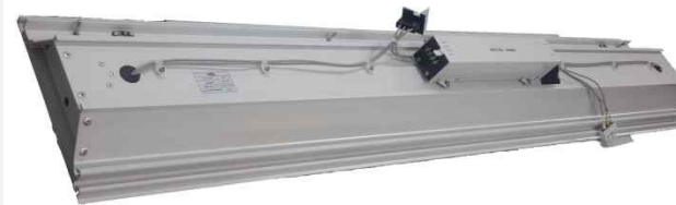
PASSENGER LIGHT ASS'Y