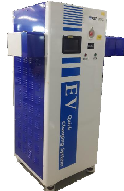
전기자동차 3CH 급속충전기 CASE ASS'Y