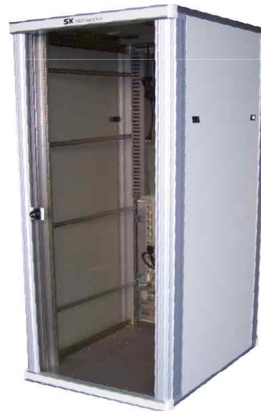
INDOOR CABINET RACK ASS'Y