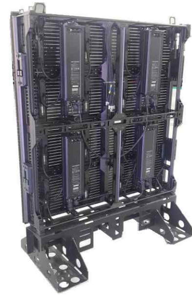
행사용 조립설치형 전광판 FRAME ASS'Y