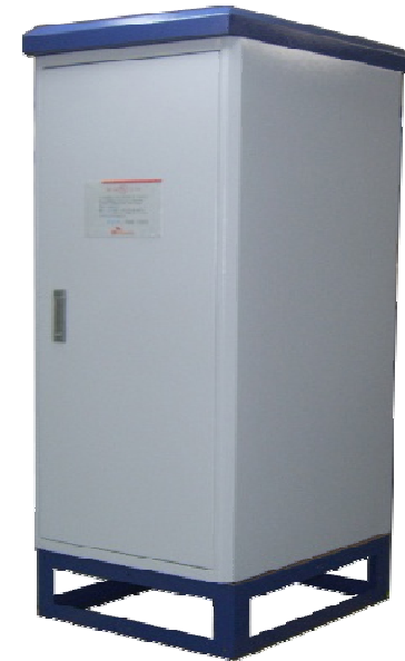
OUTDOOR CABINET RACK ASS'Y