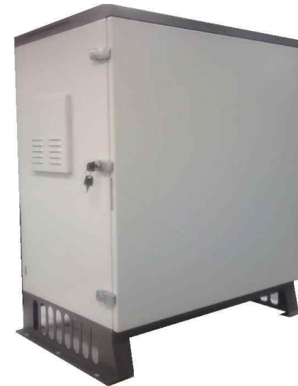
태양광 축전지 CASE ASS'Y