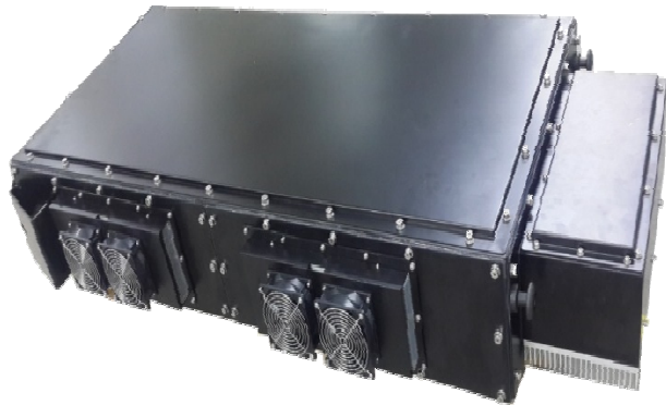
현대중공업 전지지게차 BMS 축전지 CASE ASS'Y