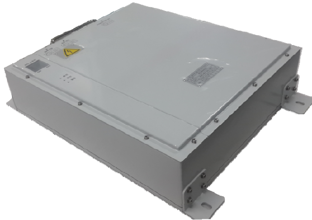
WIRELESS COMMUNICATION BATTERY ASS'Y