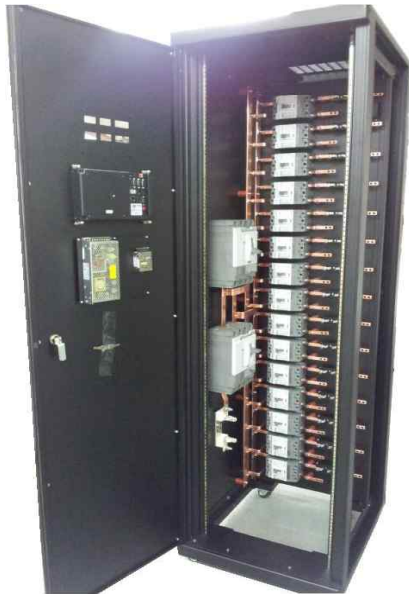
INTERNET DATA CENTER 전원 분배반