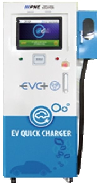
전기자동차 급속 충전기 CASE ASS'Y