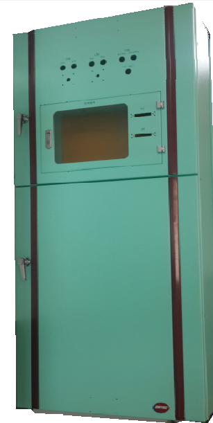
LBS SYSTEM FRAME ASS'Y