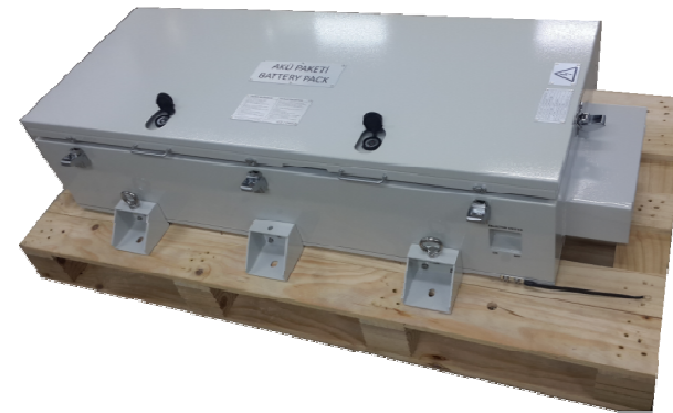
터키향 전동차 축전지 CASE ASS'Y