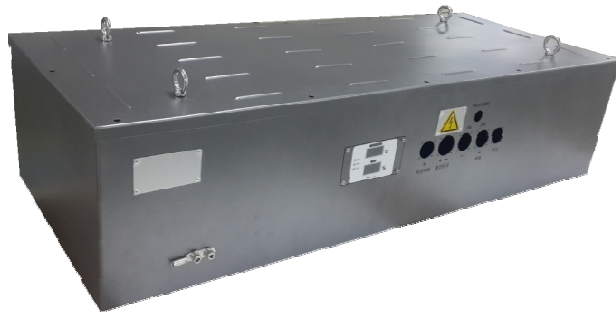
부산 1호선 전동차 축전지 CASE ASS'Y