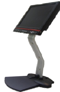
골프 스윙 분석기 FRAME ASS'Y