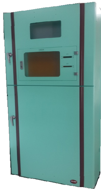
LBS SYSTEM FRAME ASS'Y