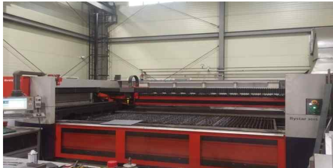
LASER CUTTING MACHIN