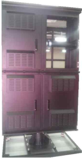
옥외 전광판 FRAME ASS'Y (열 교환기 적용)