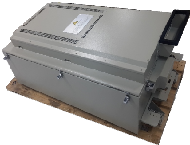
SIZE - 1,650 x 1,115 x 280