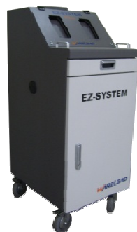
CAR REPAIR SYSTEM CASE ASS'Y