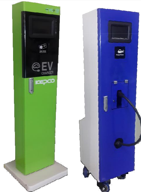
전기자동차 완속 충전기 CASE ASS'Y