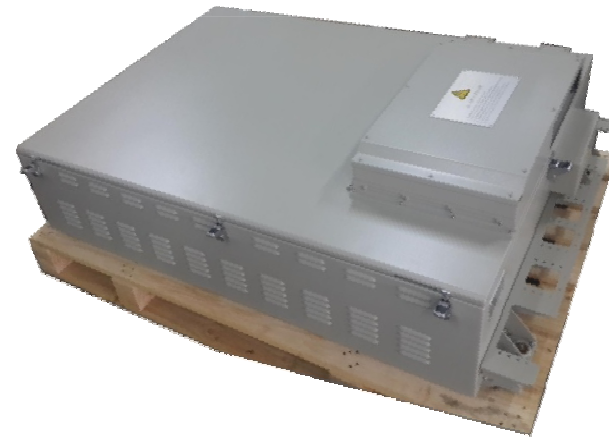
전기버스 축전지 CASE ASS'Y